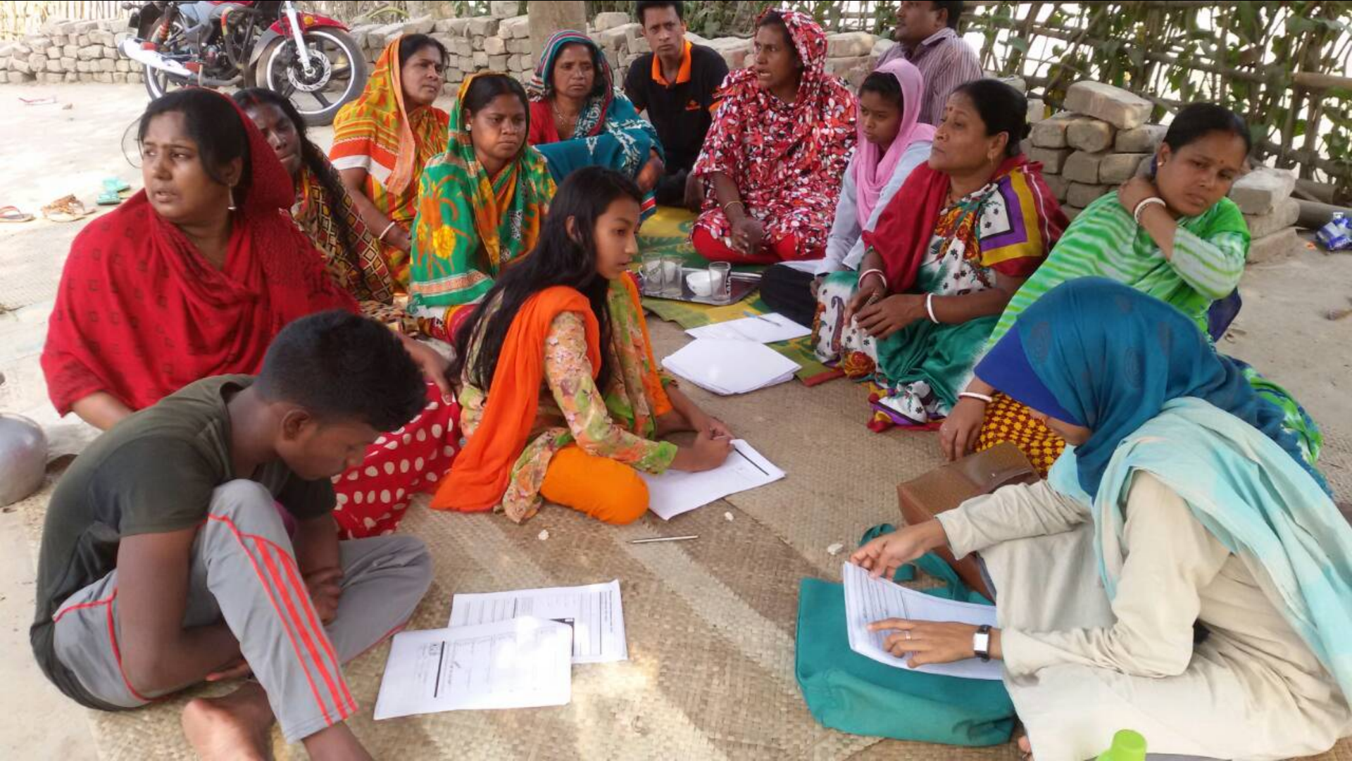
The technical team assisted in running the session at the very first community for easier understanding