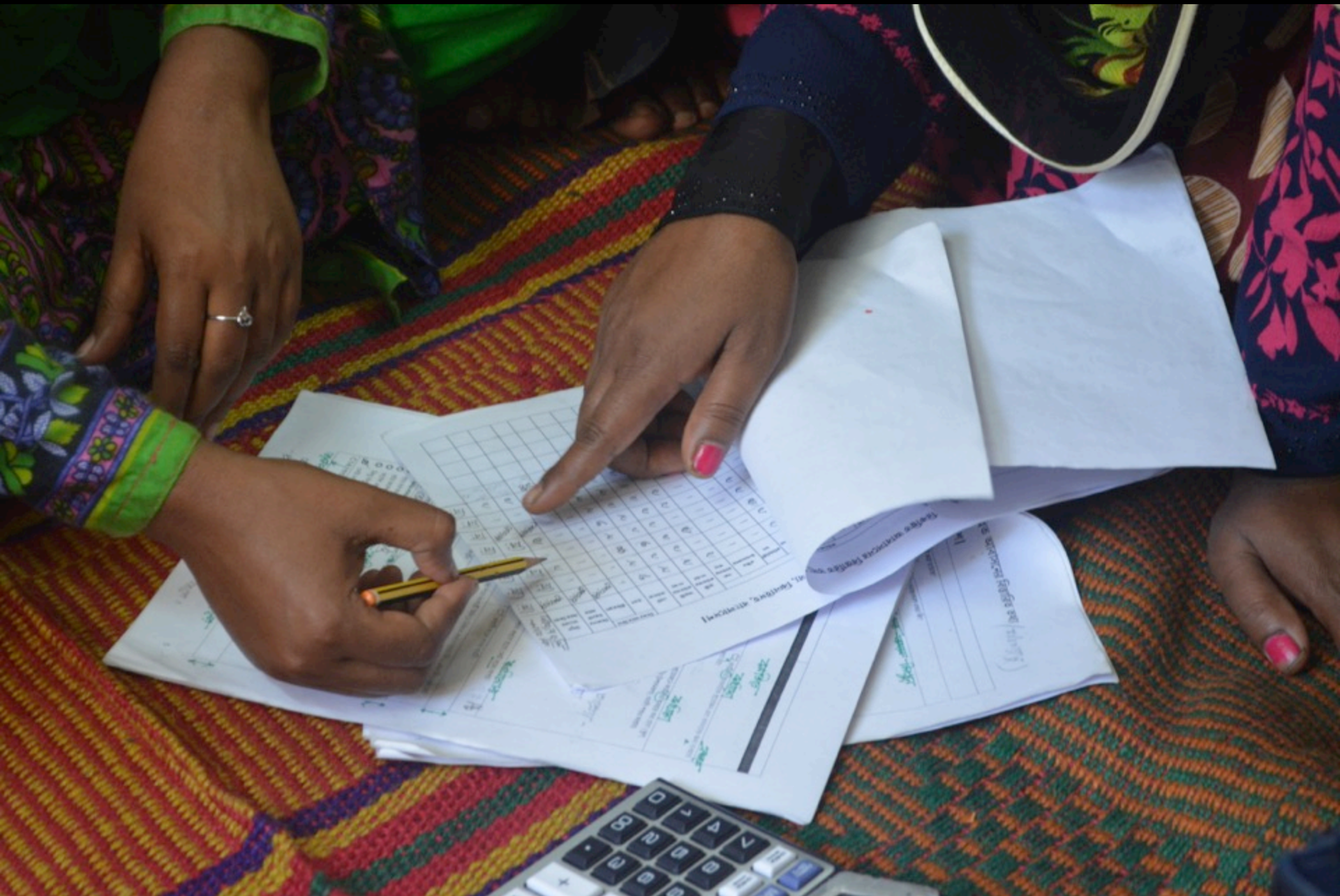
Counting and recounting, manually