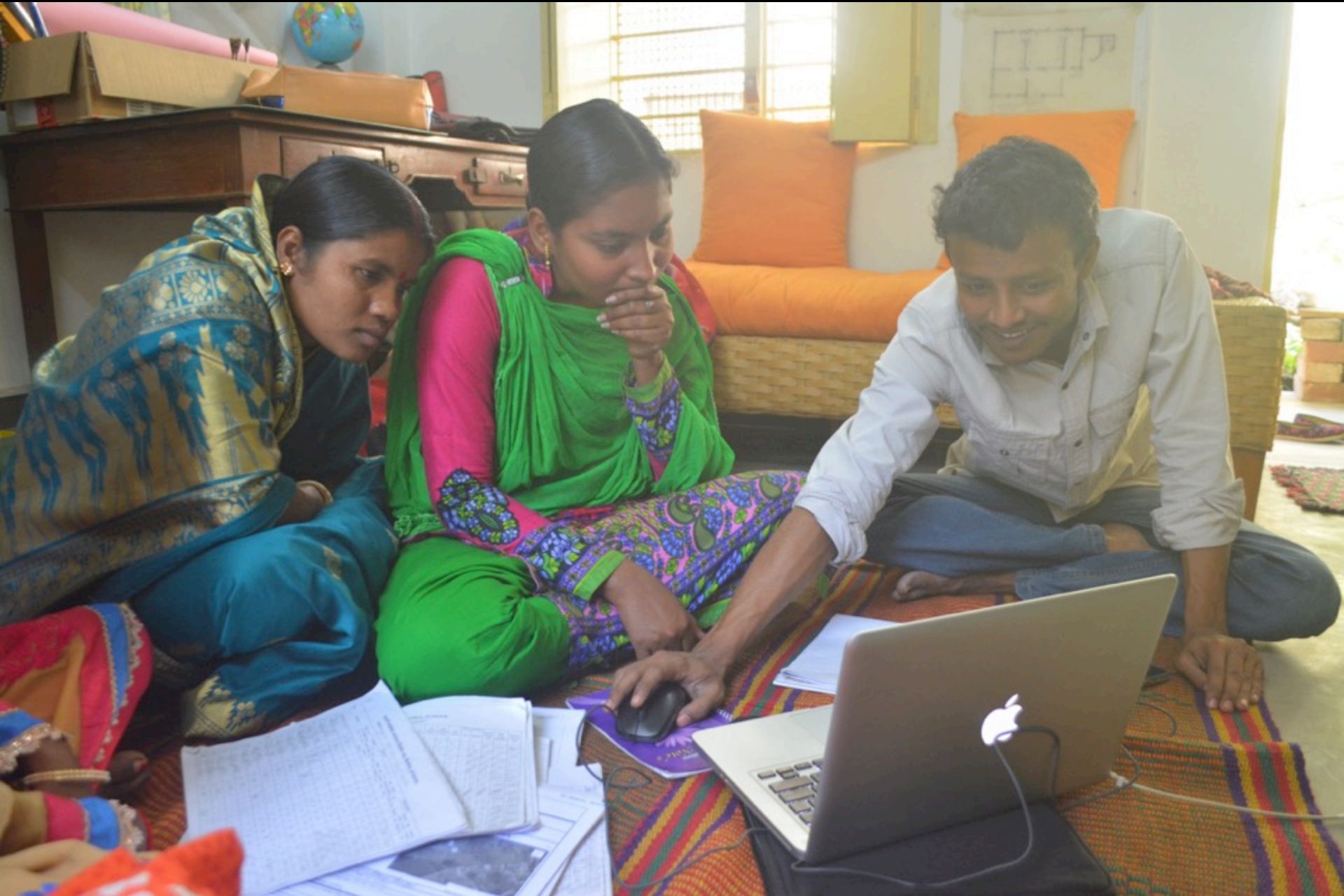
Working with technical team to create digital maps